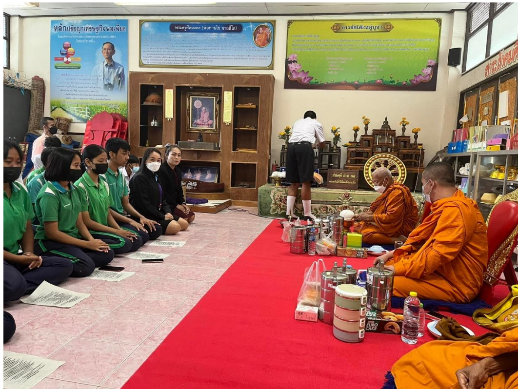
ทำบุญตักบาตรทุกวันพฤหัสบดีตามโครงการโรงเรียนวิถีสอนศึกษา