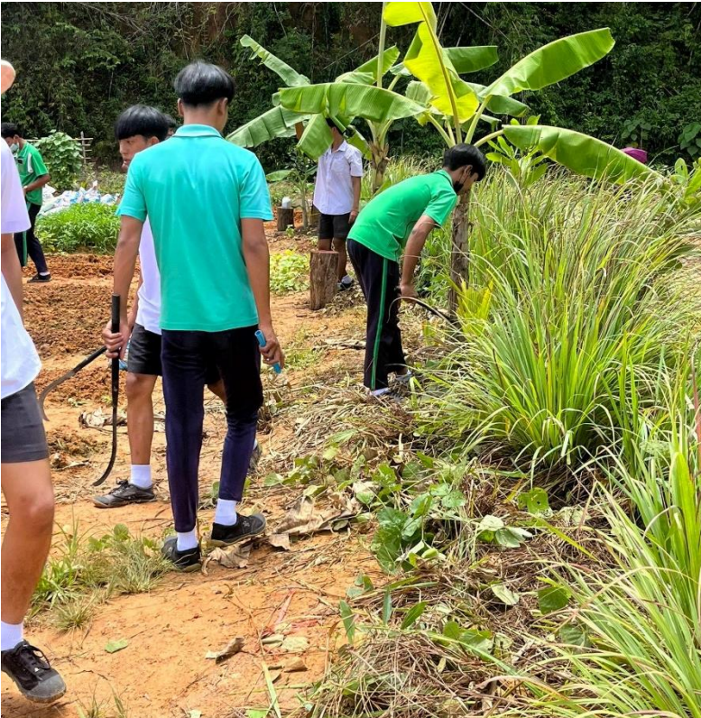
จิตอาสาบำเพ็ญประโยชน์ต่อโรงเรียน