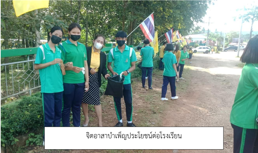
จิตอาสาบำเพ็ญประโยชน์ต่อโรงเรียน